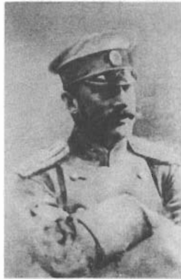
Герцог Г.Н. Лейхтенбергский