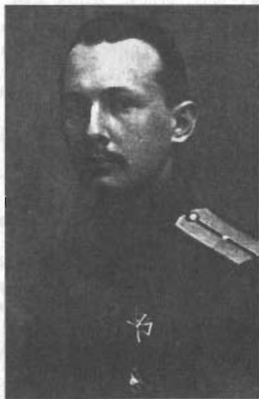
Князь А.Е. Трубецкой