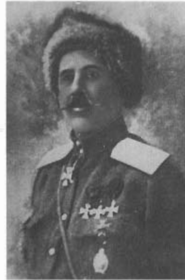
Граф Ф.А. Келлер