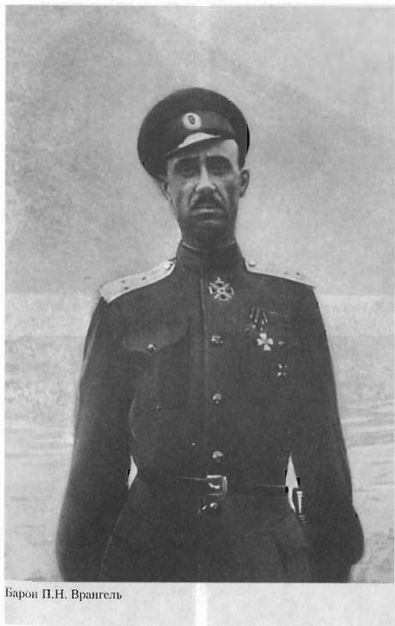
Барон П.Н. Врангель