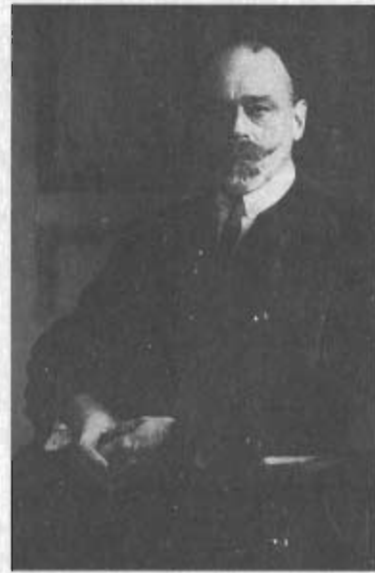
Герцог Н.Н. Лейхтенбергский