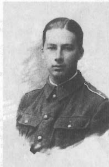
Герцог Д.Г. Лейхтенбергский