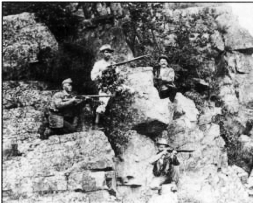
Буры позируют возле железной дороги у Претории

Военный министр, по Главному штабу, 27 января 1900 г. № 17, секретно.