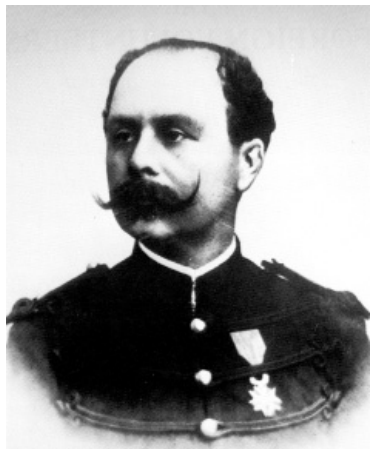
Французский полковник (бурский боевой генерал) (фехт-генерал) граф Вильбуа де Марейль, командир Иностранного легиона (сборного отряда добровольцев). На снимке он изображён с французским орденом Почётного легиона

чит, там было плохо. Буры разбиты вчера под Колесбергом. Кронье ещё не высвободился. Англичане попросили перемирия для уборки раненых. Буры согласились с тем, чтобы англичане очистили левый берег Моддер-ривер. Стейн решил биться до последней возможности и защищать Оранжевую Республику. Блумфонтейн в опасности. Стейн при неудаче отступит в Трансвааль и здесь соединится с Крюгером . Вообще положение не блестящее у буров. Подписалось у меня 10 человек, а другие 18 условно согласились: если Вильбоа примет их на время. Жаль, что в одно время мы начали формировать. И без этого это трудно, а тут ещё и конкуренция. (...)