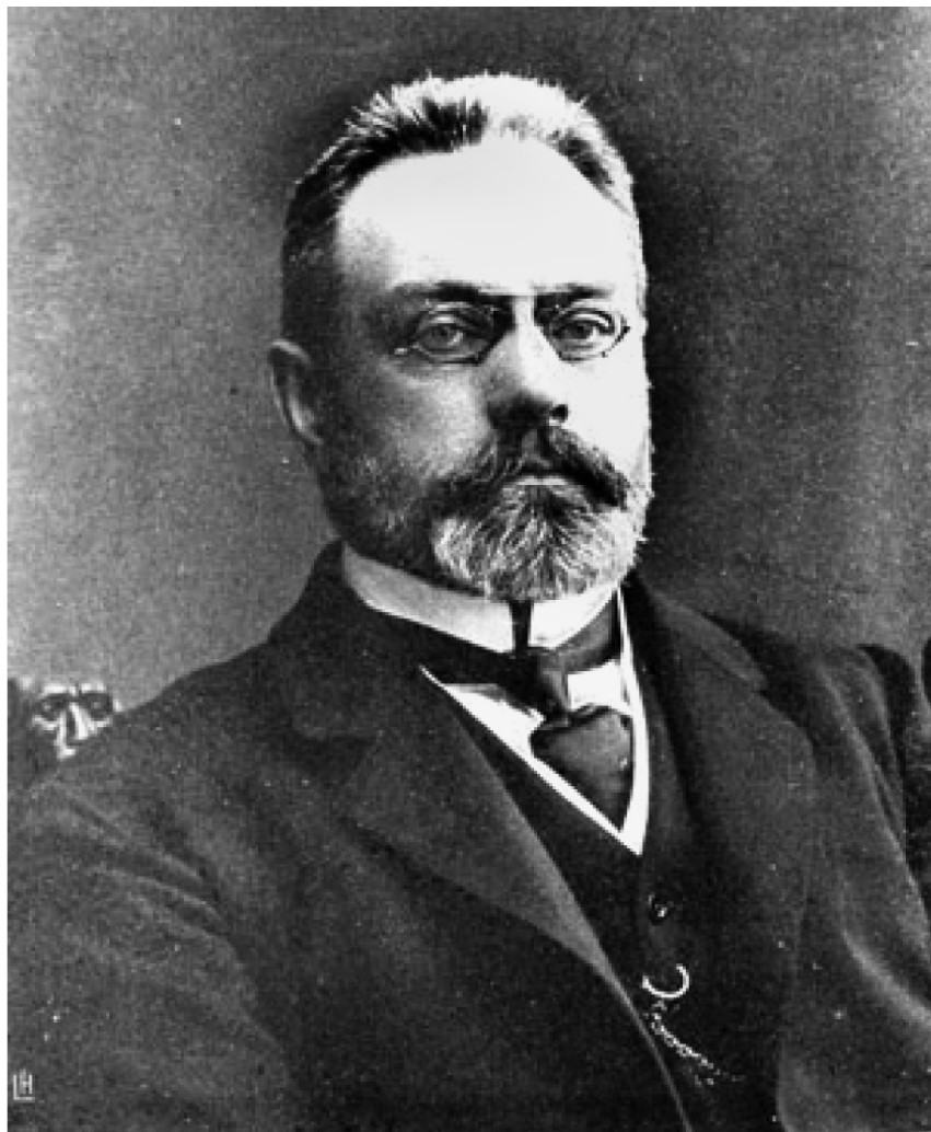
Русский доброволец Александр Иванович Гучков.

С марта 1917 г. – военный министр в первом составе Временного правительства