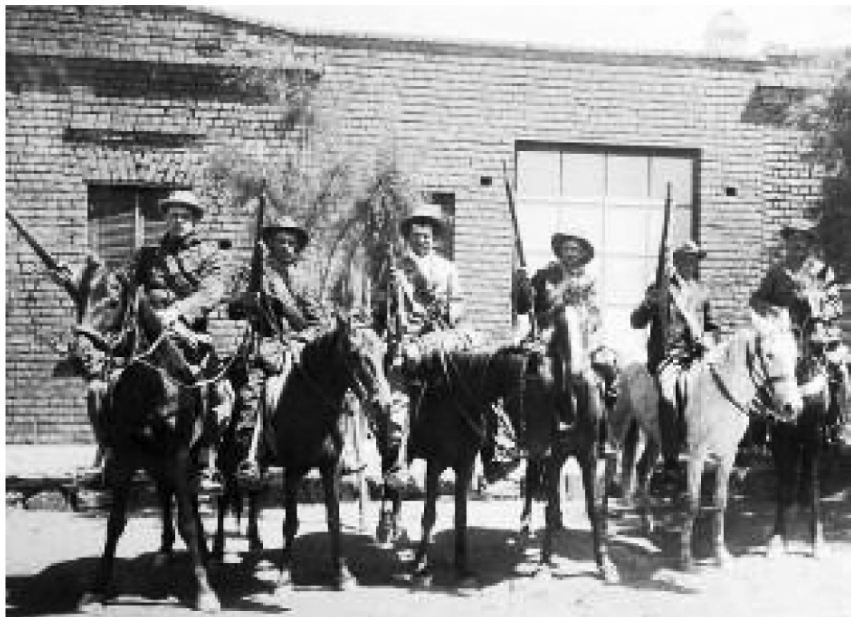
Буры позируют для фотографии

«клянёмся!» Совсем как из «Вильгельма Теля», только мечей не хватало, потому что у буров нет холодного оружия, что очень жаль, так как отсутствие холодного оружия или штыка часто не даёт им полной победы.