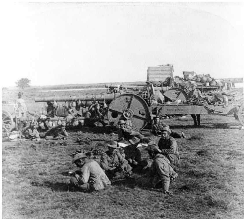
Английские тяжёлые морские орудия калибра 152 мм (6 дюймов). На самодельных металлических лафетах с крейсеров «Монарх» и «Дорис» в марте 1900 г. во время наступления на Блумфонтейн

Наш Красный Крест в Южной Африке (в сокращении) Претория, 2 марта