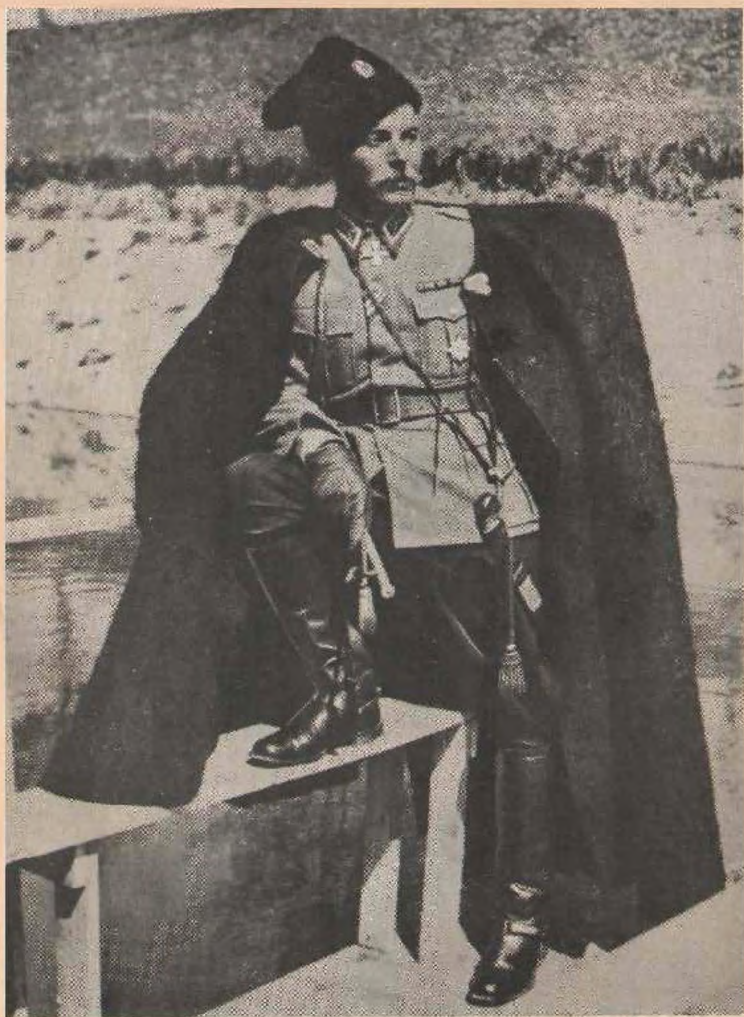
Походный Атаман всех Казачьих Войск и командующий Казачьими войсками Вооруженных Сил Комитета Освобождения Народов России генерал-майор Иван Никитич Кононов