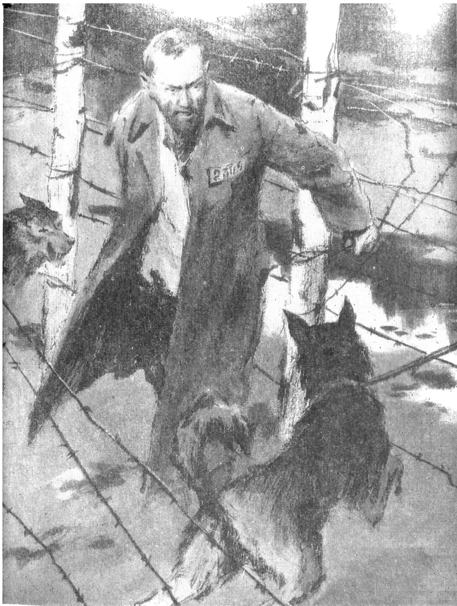
Пасечный стоял, прижавшись к проволоке.