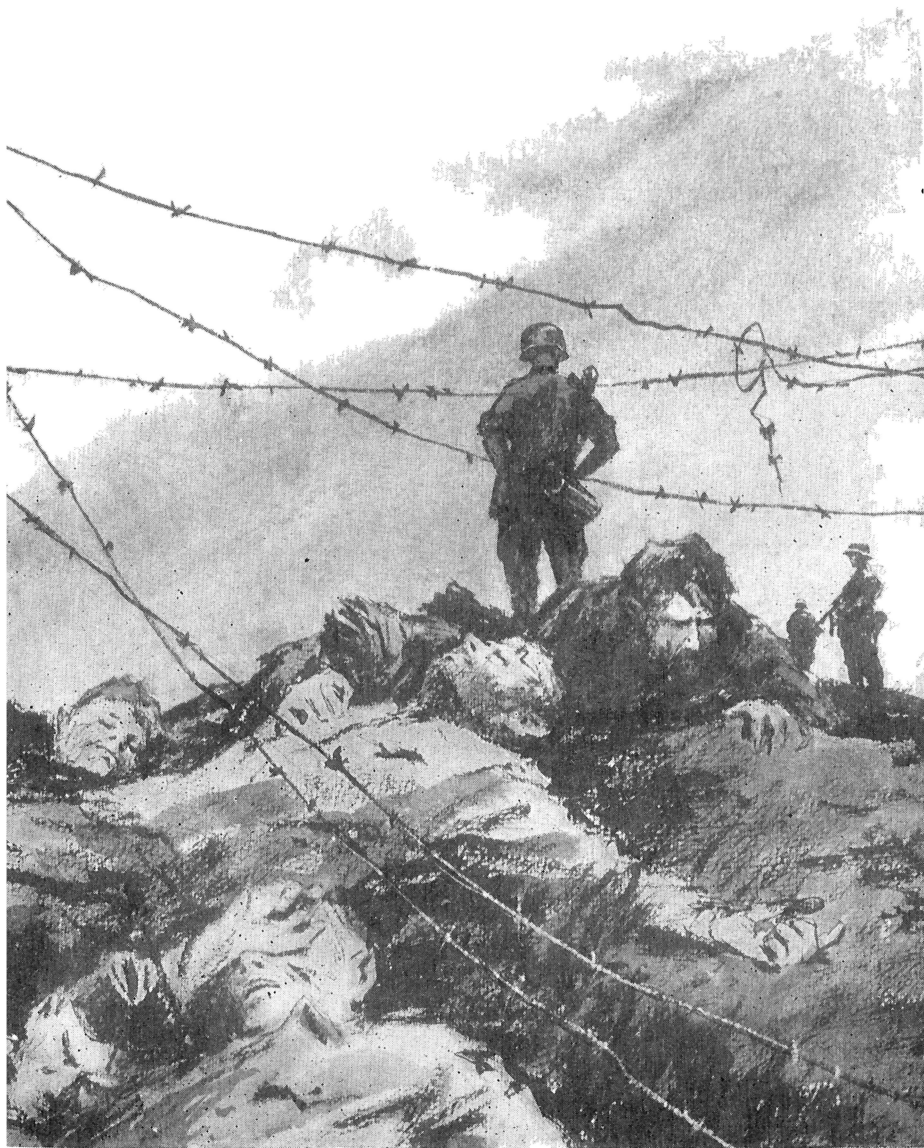
Побежденный усталостью, лагерь притих, забывшись в тревожном сне. (к стр. 21)