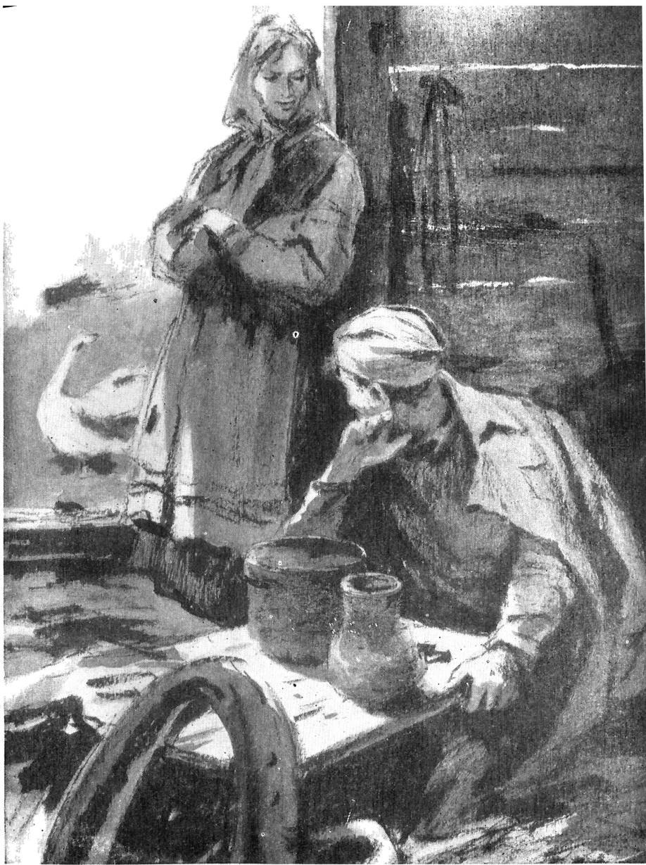
— Счастливый путь, пане русский! (к стр. 156)