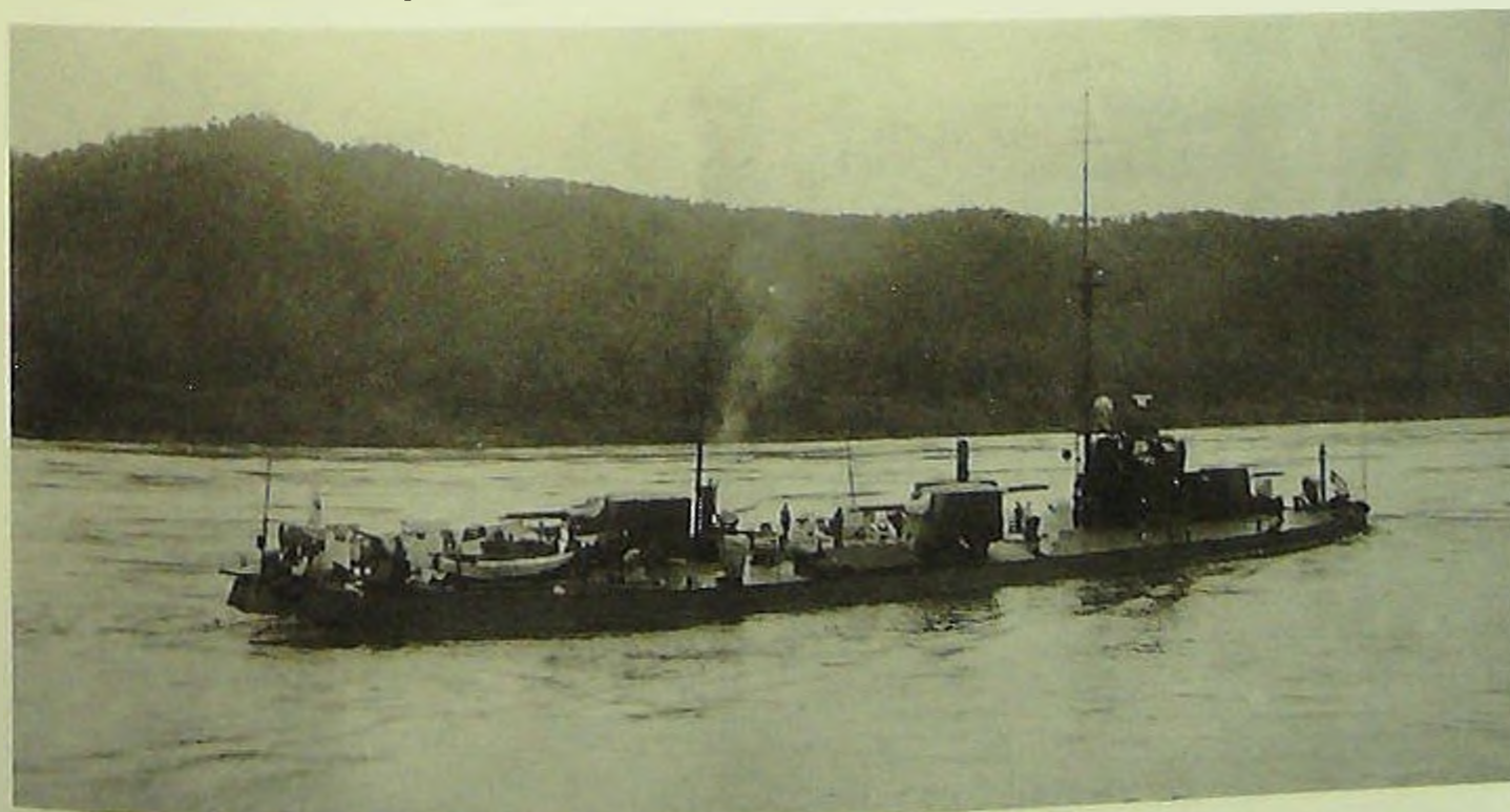
Монитор «Красный Восток» на р. Амур.