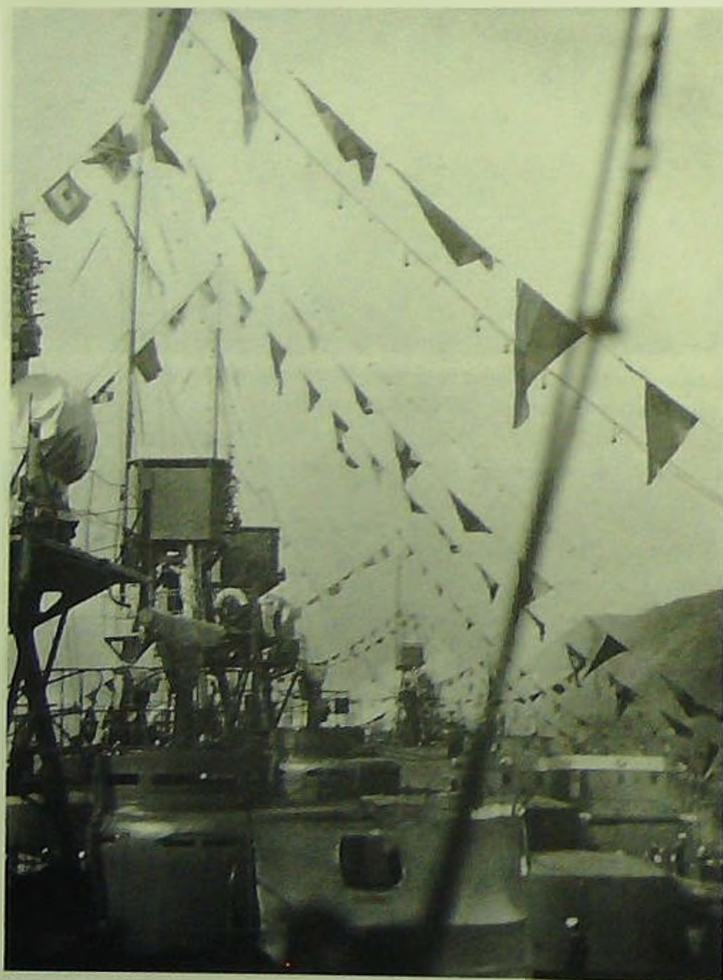
Корабли АКВФ во время первомайского праздника 1935 г.