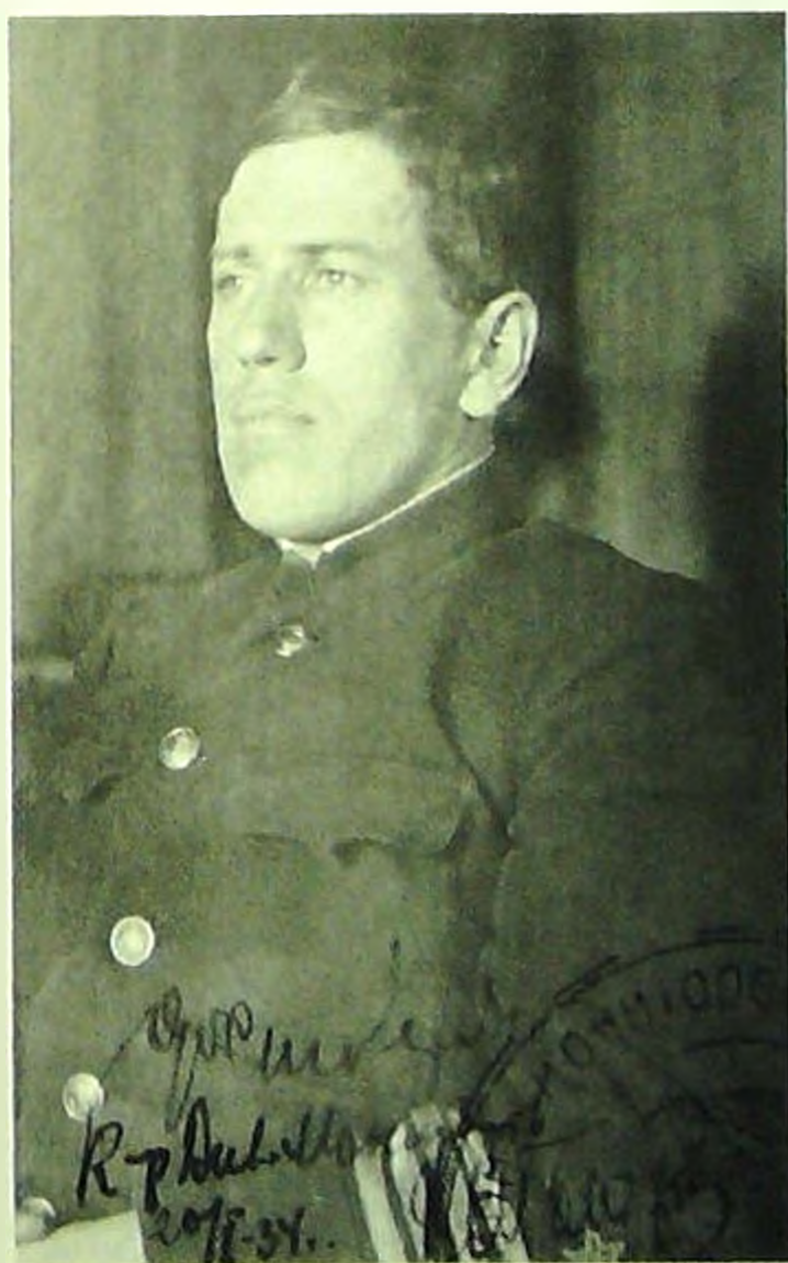
Командир дивизиона мониторов капитан-лейте- нант Н.С. Кузнецов. Арестован 9 октября 1937 г., приговорен к расстрелу 25 марта 1938 г.