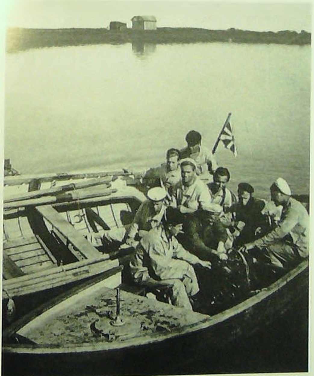
Моряки-амурцы ремонтируют двигатель бота.