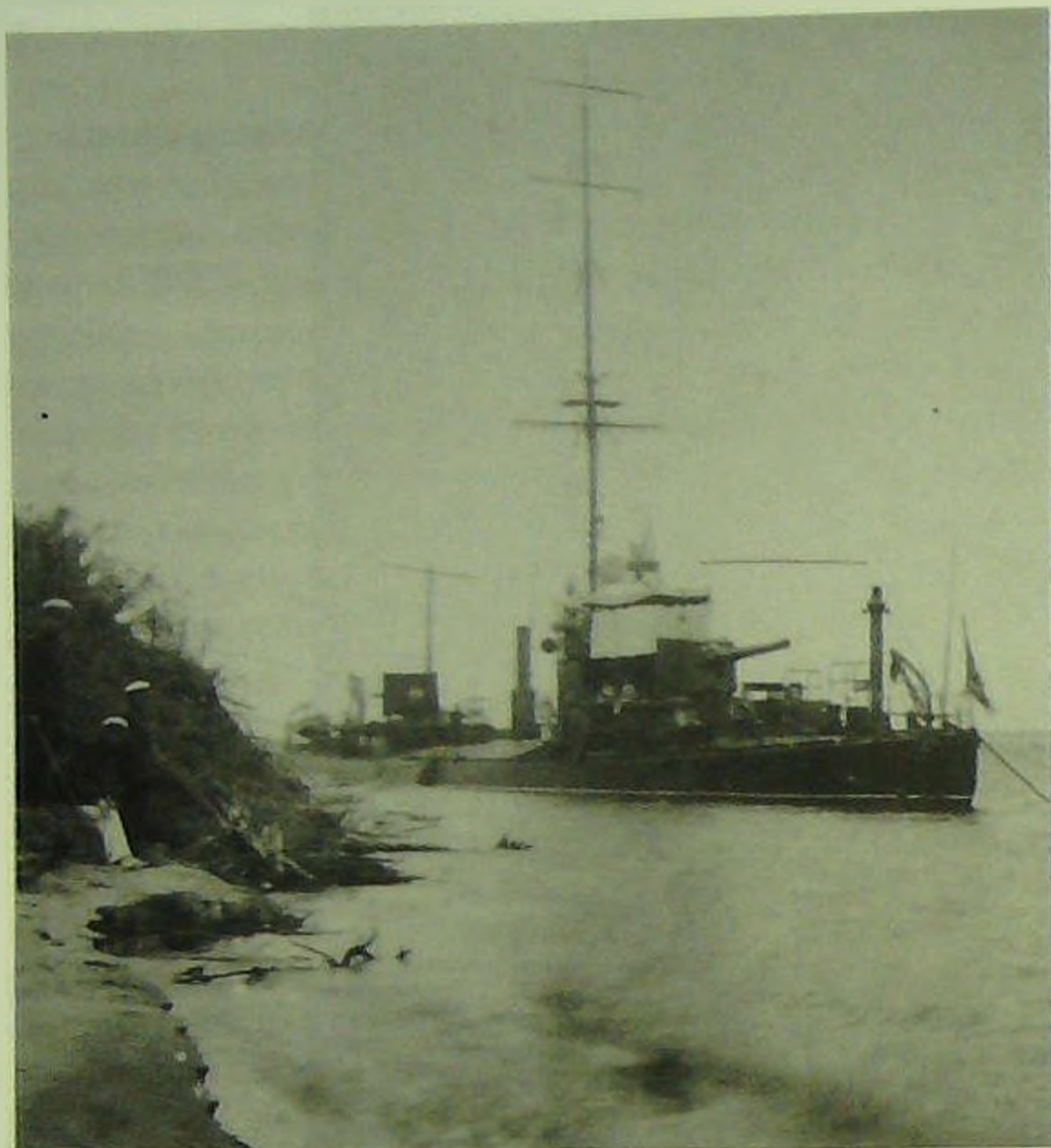
Канонерская лодка у амурского берега.