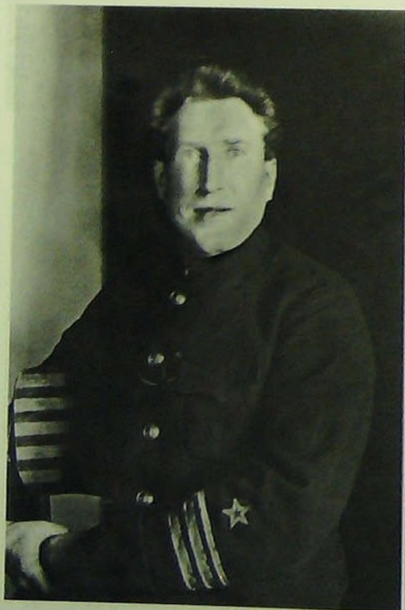
Командир дивизиона мониторов ка- питан 2 ранга П.И.Лепин. Арестован 27 сентября 1937 г., приговорен к рас- стрелу 25 марта 1938 г.