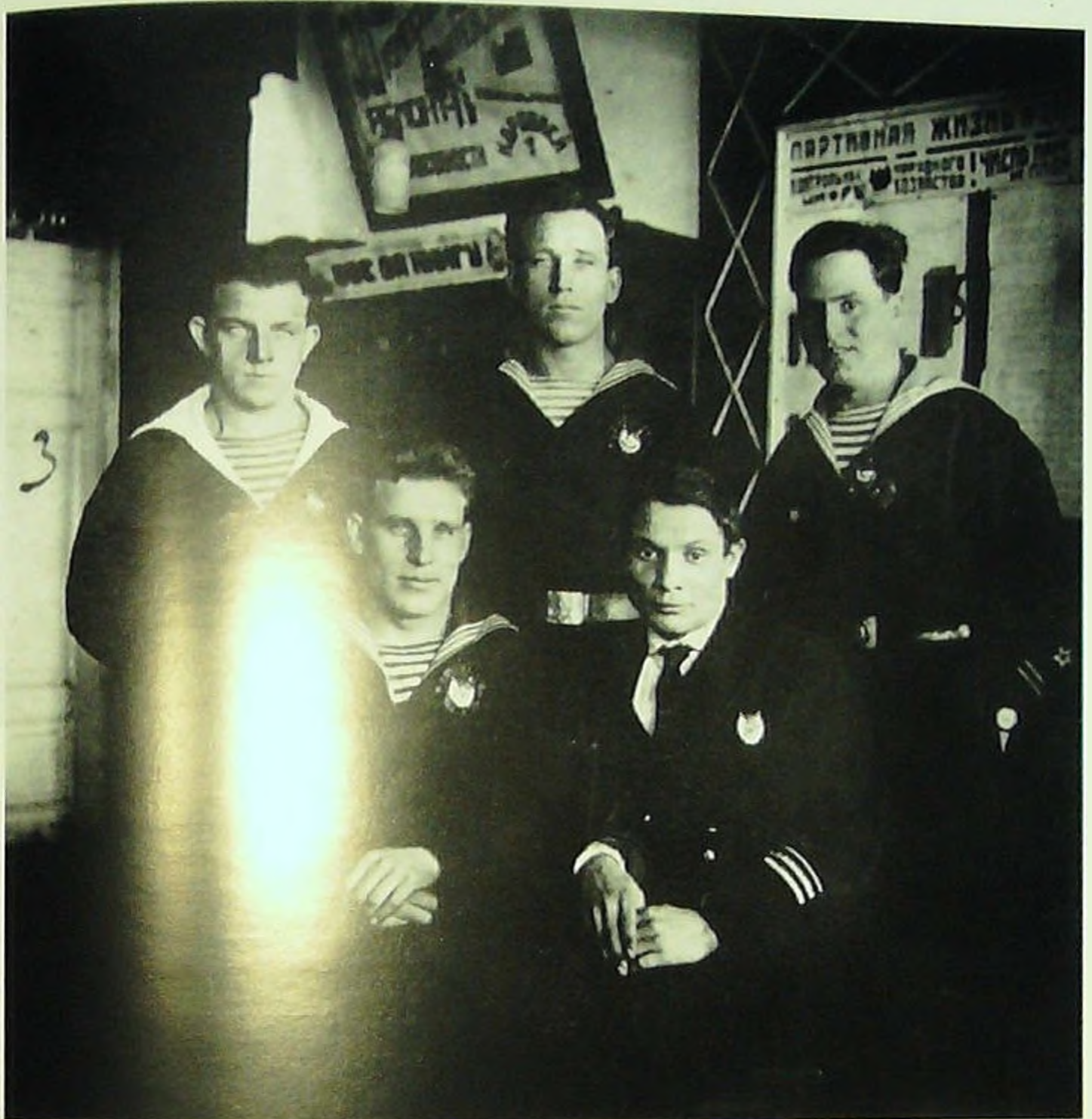
Моряки монитора «Сун-Ят-Сен», награжденные орденом Красного знамени за бои под Лаха Су Су во время вооруженного конфликта на КВЖД.