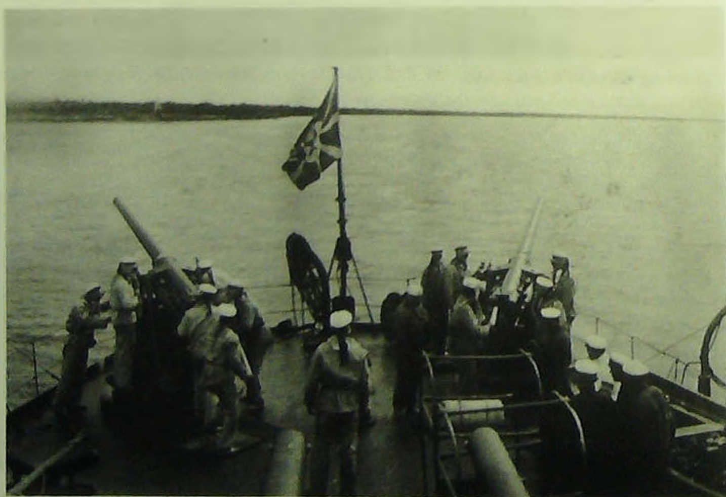
Артиллеристы отрабатывают задачи в средствах химической защиты.