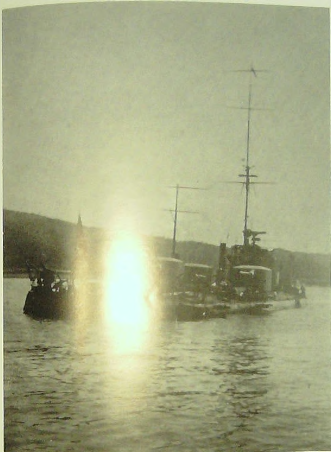
Монитор «Ленин» в охранении.