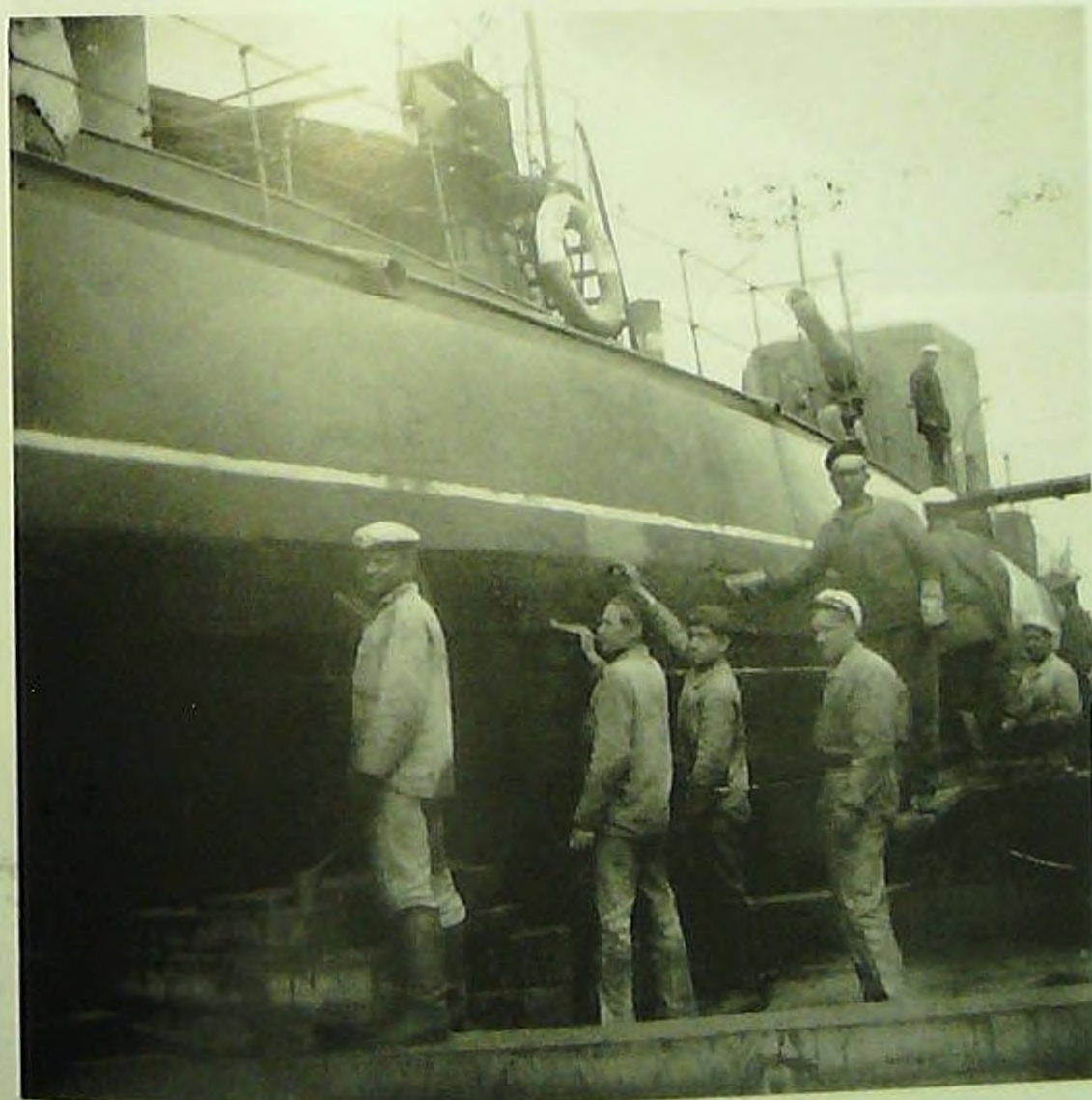
Покраска краснофлотцами монитора «Свердлов».