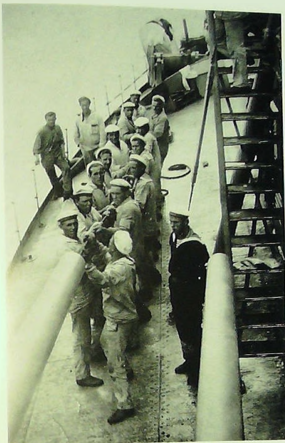
Артиллеристы мони гора во время чистки орудий.