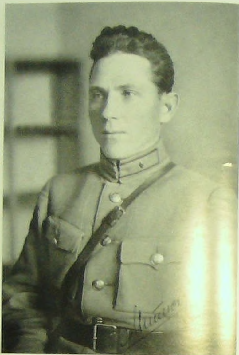
Военный комиссар АКВФ диви- зионный комиссар П.С.Митюков. Арестован 4 февраля 1938 г., приго- ворен к расстрелу 10 сентября 1938 г.