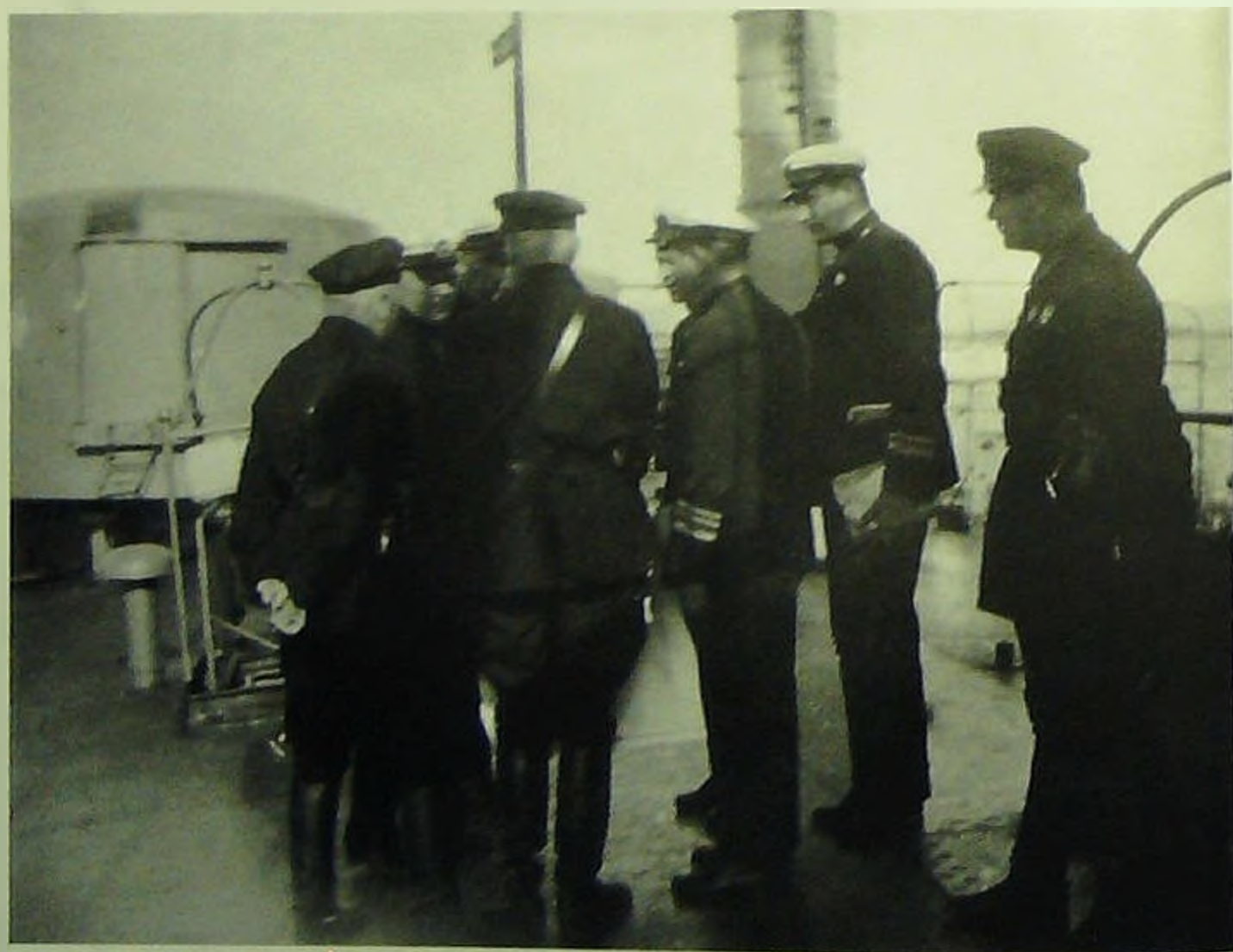
На палубе монитора командование флотилии и представители командования ОКДВА.