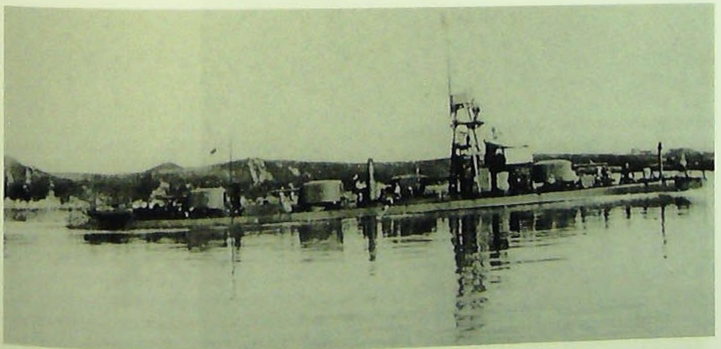
Монитор «Сун-Ят-Сен» на р. Амур.