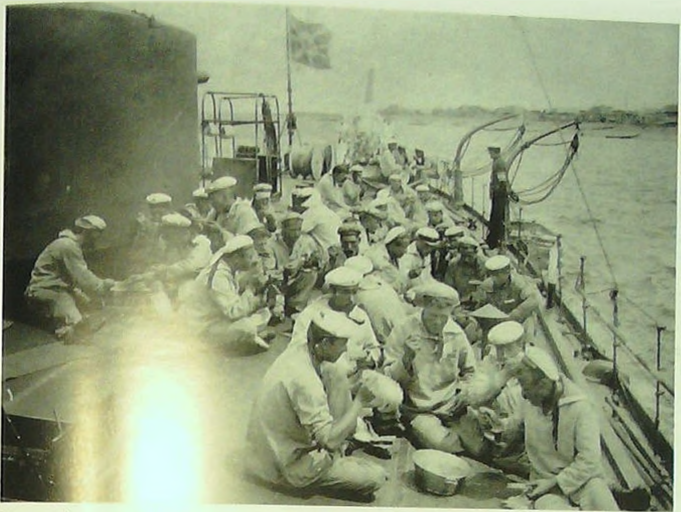
Краснофлотские моряки в обеденный час на палубе монитора.