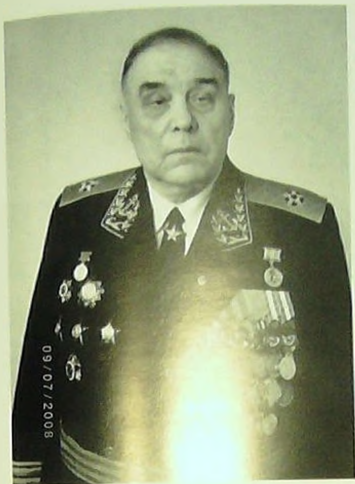
Капитан-лейтенант А.И. Бирин . Арестован 20 января 1937 г., освобожден 7 февраля 1939 г. (ранее командир эскадры в Финляндии) — адмирал флота.