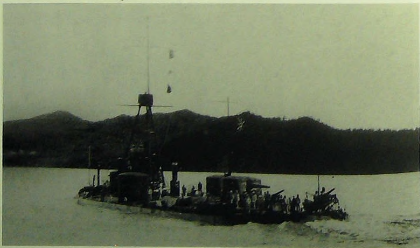
Монитор «Сун-Ят-Сен» на страже дальневосточных границ на р. Амур.