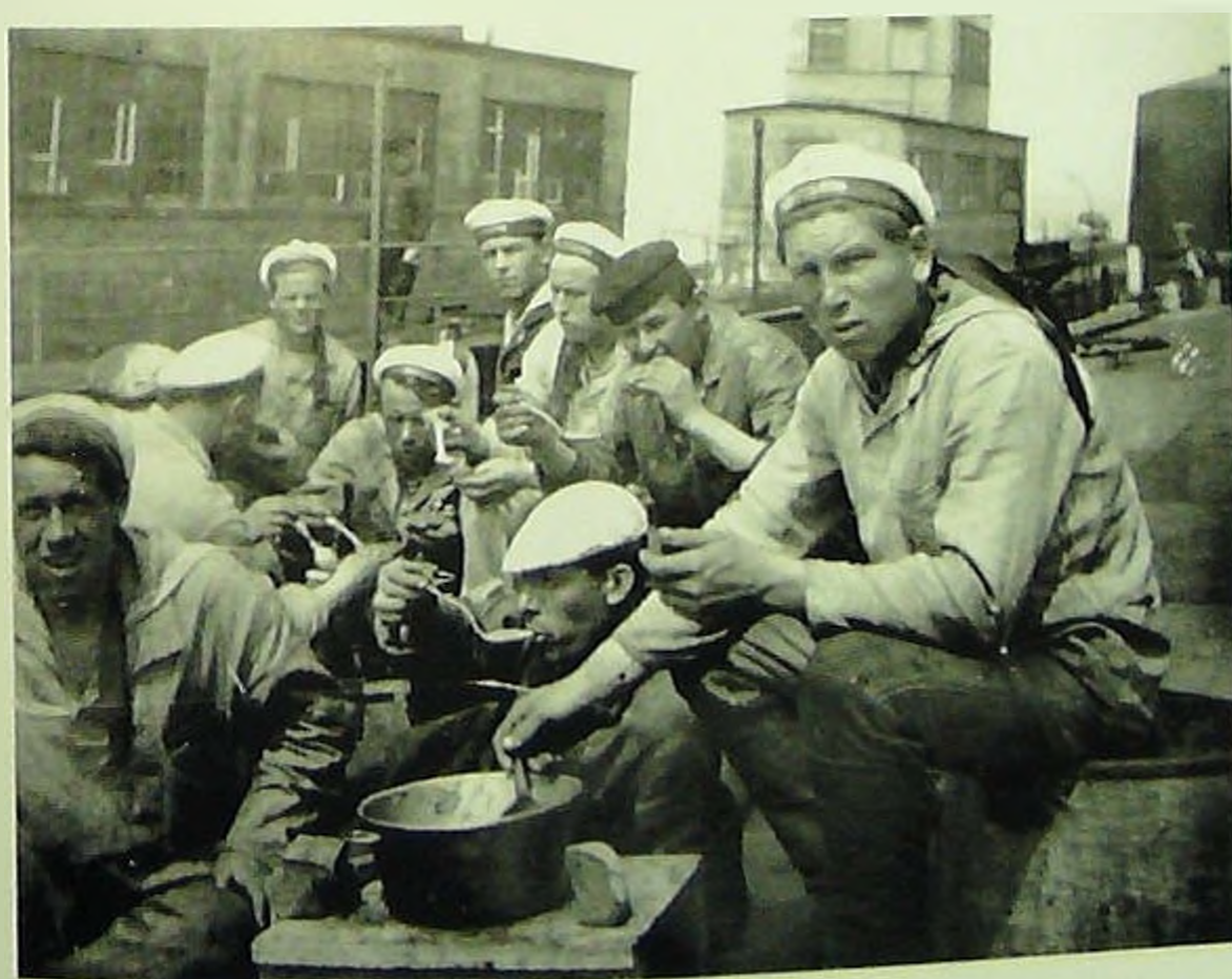
Моряки АКВФ во время обеда.