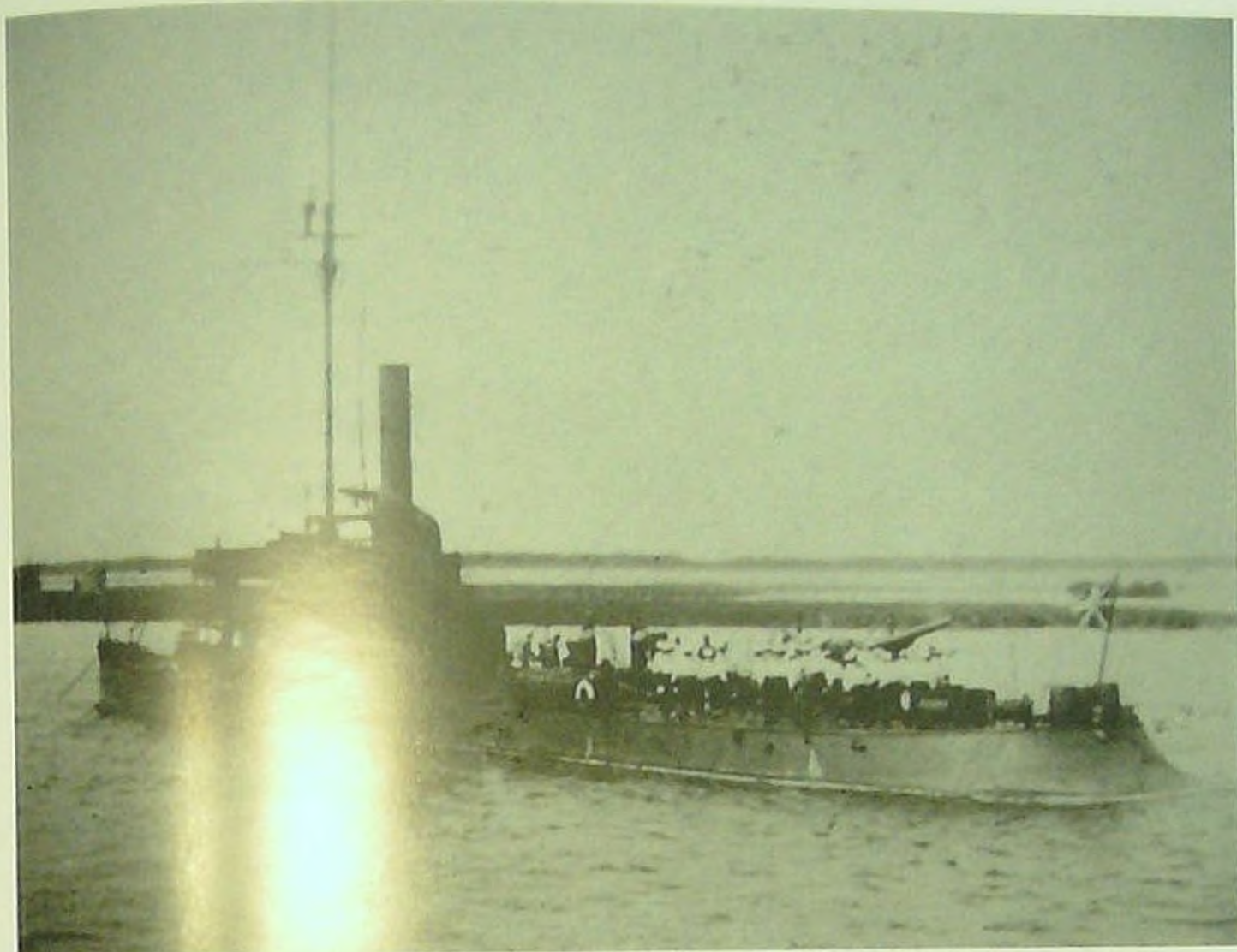
Канонерская лодка «Свирь».