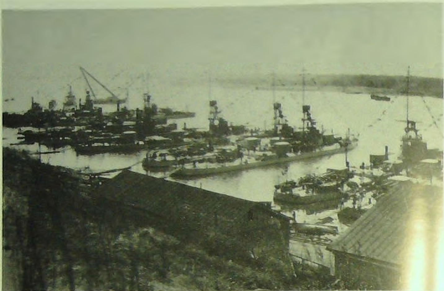
Корабли АКВФ в Осиповском затоне.