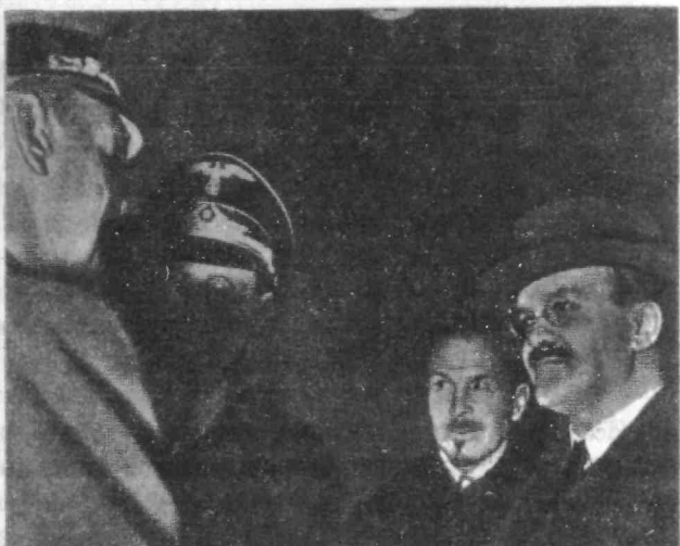
Визит министра иностранных дел СССР В.М. Молотова в Берлин. Слева - министр иностранных дел Германии Риббентроп. 12 ноября 1940 г.