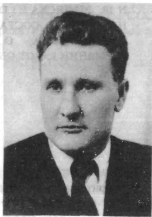
Петр Ильич Гудимович (Иван), резидент нелегальной разведки НКВД - НКГБ СССР в Варшаве в октябре 1940 - июне 1941 г.