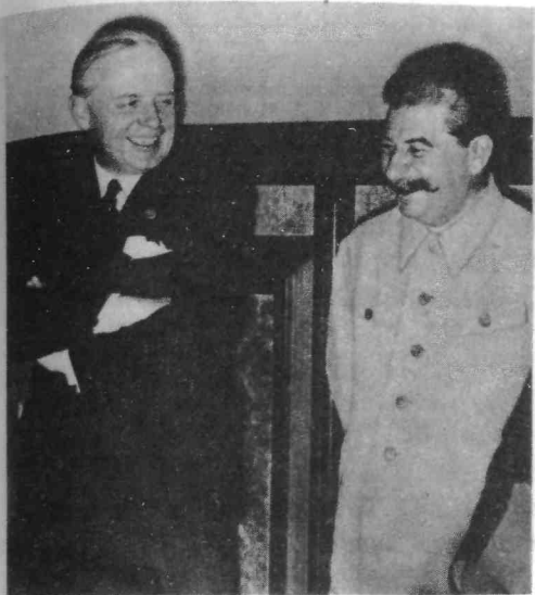
И.В. Сталин и И. Риббентроп.