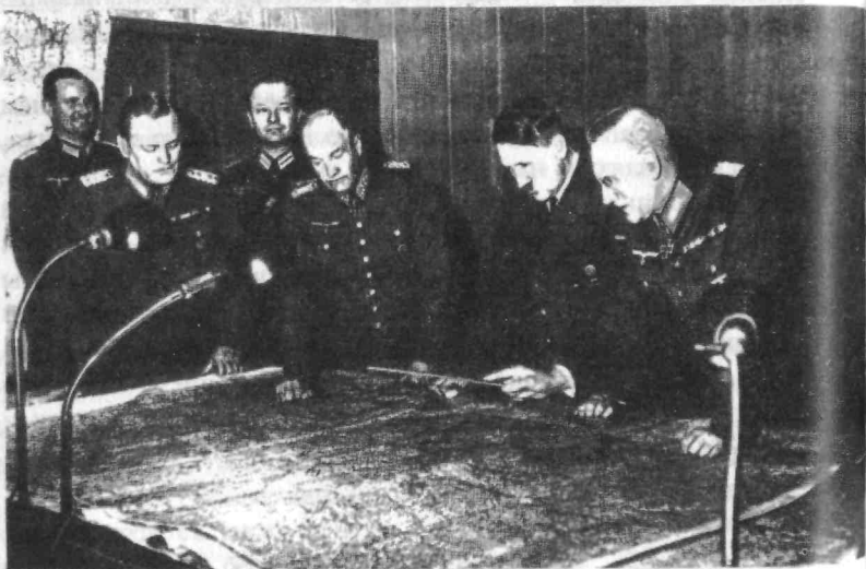
Начальник верховного командования вермахта генерал-фельдмаршал Кейтель, главнокомандующий сухопутными войсками генерал-полковник фон Браухич, Гитлер, начальник генерального штаба генерал-полковник Гальдер. 1940 г.