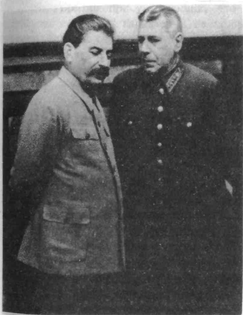
И.В. Сталин и Б.М. Шапошников.