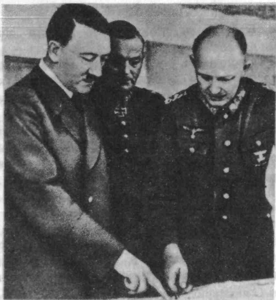
Гитлер, Кейтель, Йодль над картой Европы.