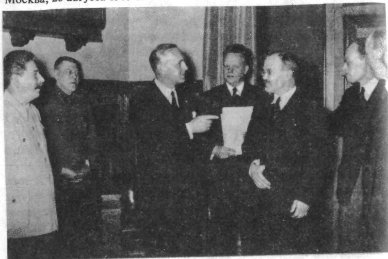
И.В. Сталин, Б.М. Шапошников, И. Риббентроп, А.А. Шкварцев, В.М. Молотов, В.Н. Павлов.

Подписание советско-германского договора о ненападении. Москва, 23 августа 1939 г.