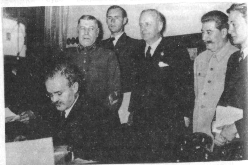
Нарком иностранных дел В.М. Молотов подписывает советско-германский договор о дружбе и границе между СССР и Германией.