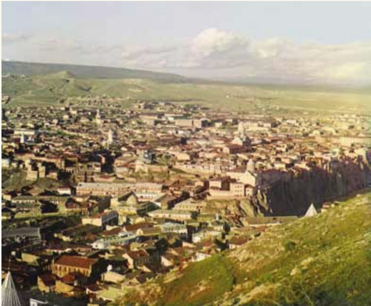
Тифлис. Фото М.С. Проскурина-Горского, 1912 г.

15 августа 2-й батальон нашего полка выступил на охрану железной дороги. 8-й роте был назначен участок железнодорожной линии Закавказской ж. д. от Мухляни — Самтреди — до Поти. Проезжая через Тифлис, я заходил к Леону Микиртычеву, проведал их. Он очень обрадовался и не ожидал меня. Жили они на улице 19-го февраля, №42.